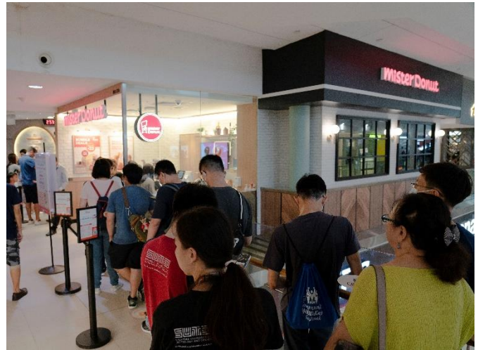
シンガポール 第 1 号店 ミスタードーナツ Junction8 ショップ（写真左） と待機列の様子（写真右）