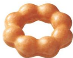
人気 No.1 ポン・デ・リング